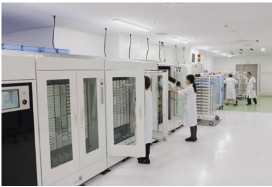
▲薬剤部内部の様子