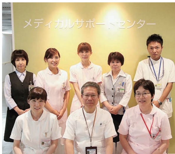
メディカルサポートセンター

メディカルサポートセンターはセブンスイレブンを通り過ぎた先の1階病棟の入り口付近にあり