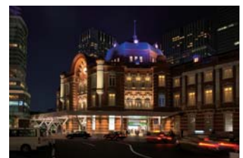
【東京駅】(東京都千代田区) 株式会社 ライティング プランナーズ アソシエーツ、金子俊男

協賛企業：サノフィ株式会社、アストラゼネカ株式会社、アステラス製薬株式会社、ジョンソン・エンド・ジョンソン株式会社、株式会社三和化学研究所、興和製薬株式会社、日本イーライリリー株式会社、キッセイ薬品工業株式会社、アークレイ株式会社、テルモ株式会社、日本ベーリンガーインゲルハイム株式会社、株式会社浅田鈴、積水メディカル株式会社、サラヤ株式会社、株式会社スズケン、ニプロ株式会社、富士フイルム ファーマ株式会社、ロシュDCジャパン株式会社、アボットジャパン株式会社、サンスター株式会社、日本メトロロニック株式会社、ティーベック株式会社、味の素株式会社、パナソニック ヘルスケア株式会社 (順不同/2017年10月現在)