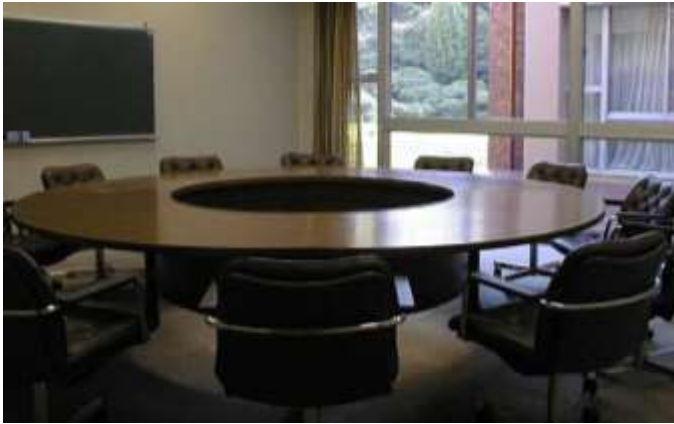
1階小会議室A: 控え室 兼 託児スペース