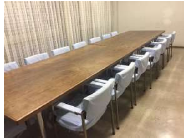
1階小会議室B: グループC