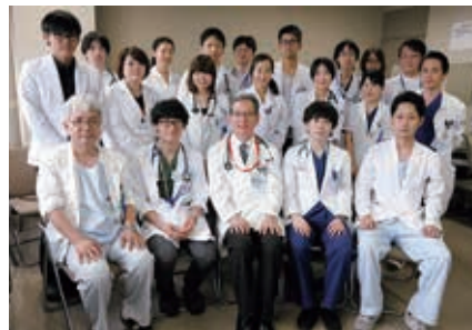
▲循環器内科のスタッフ

循環器内科は、昭和56年の開院当初より、内科学講座循環器部門として、診療、教育、研究に携わってきました。大学病院とはいえ、佐賀県における心疾患の救急対応、特に心臓カテーテル治療まで可能な施設は限られているため、急性冠症候群や急性心不全、不整脈といった救急患者は、積極的に受け入れています。