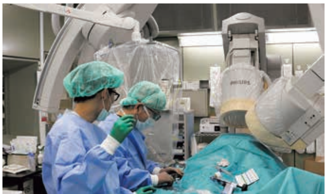
▲心臓カテーテル治療の様子

を行ってまいります。 佐賀県における重症心不全治療にも重点を置いており、補助人工心臓(LVAD)を装着した症例も少ないながら経験を重ねています。今年、本院は植込型人工心臓実施施設に認定されました。今後、体内式の補助人工心臓の植え込みが行われるようになれば、これまで長期入院を余儀なくされていた重症心不全、移植待機の患者さんの、自宅退院・外来通院も可能となるため、大変期待しております。