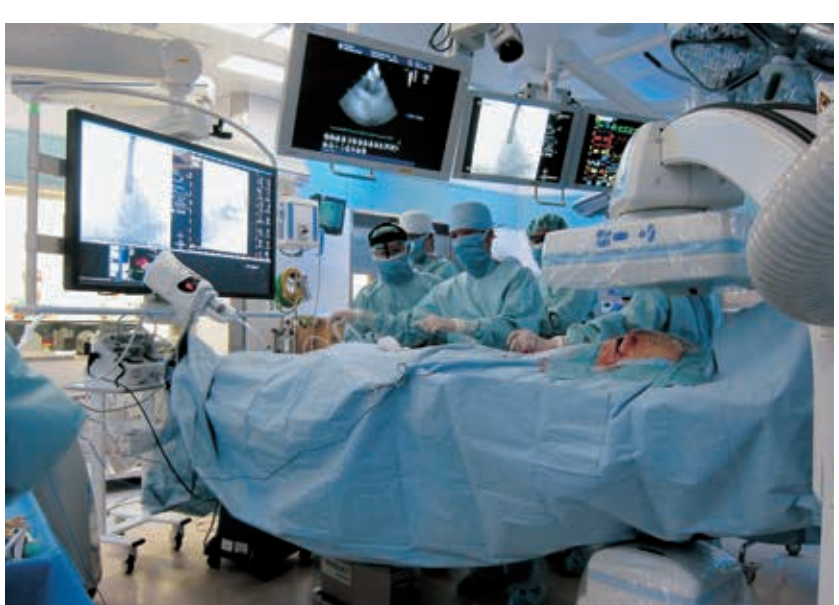
▲ハイブリッド手術室でのTAVIの様子