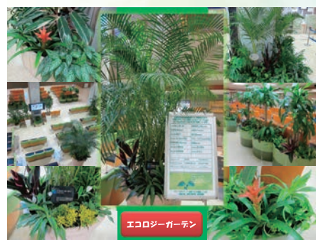
エコロジーガーデン