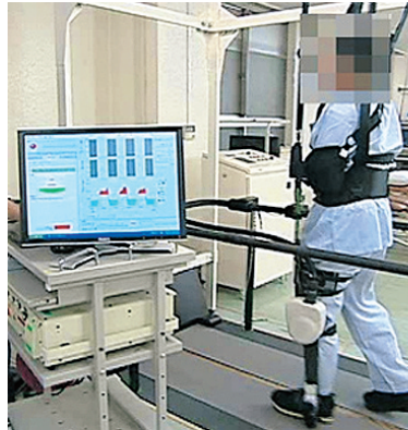
TOYOTA パートナーロボット 歩行練習アシスト