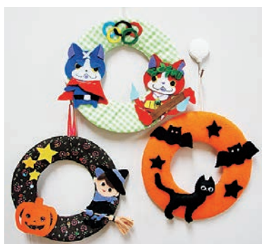
▲院内学級の児童生徒による作品

佐賀大学医学部総務課（研究・評価主担当） TEL 0952 (34) 3354 FAX 0952 (34) 2011 〒849-8501 佐賀市鍋島五丁目1番1号 ホームページ http://www.hospital.med.saga-u.ac.jp/