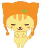
マスコットキャラクター「ミルにゃん」

カード発行は無料となっておりますので、詳しくは外来受付の佐賀 Mirca ブースにお立ち寄りください。